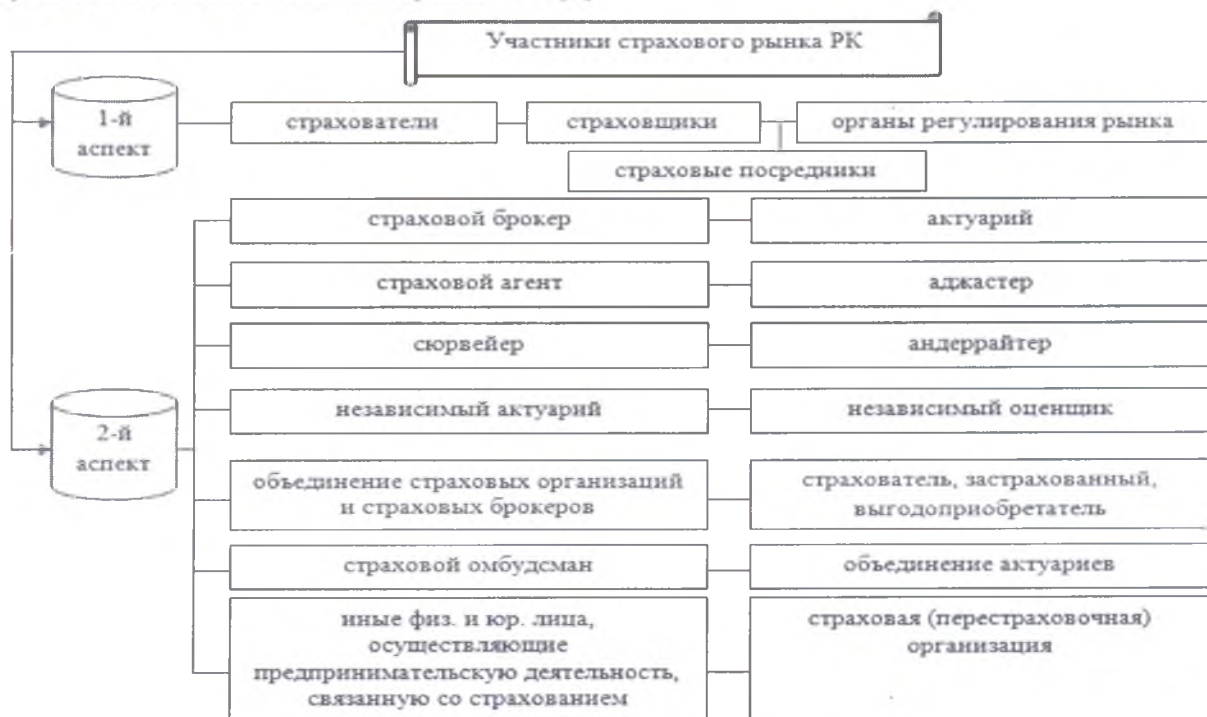
Рисунок 3 - Участники страхового рынка в РК

Согласно данным Нацбанка РК, рынок страхования в Казахстане формируют 32 функционирующие страховые (перестраховые) организации. На данный момент в РК существуют 11 видов обязательного страхования [5].