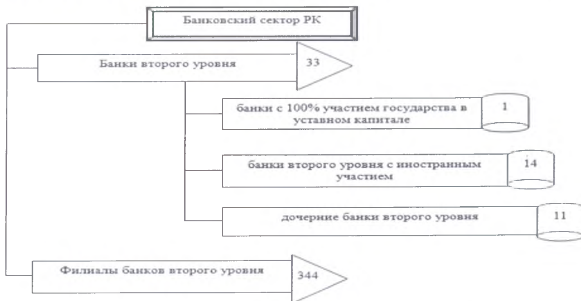
Рисунок 2 – Структура банковского сектора РК

Финансовый сектор РК состоит из пяти блоков, которые между собой взаимосвязаны и каждое звено этого экономического объекта, который играет важную роль в экономике нашей страны. Банковский сектор - является одним из важных звеньев финансовой системы и финансового сектора в целом, которое оказывает влияние на экономическое развитие страны. Банковская система РК состоит из банков первого и второго уровней: первый уровень - Нацбанк РК (центральный банк страны), второй уровень – все иные банки, кроме Банка развития Казахстана, имеющего особый правовой статус. Структура банковского сектора РК на 1 января 2018г. изображена в соответствии с рисунком 2 [3].