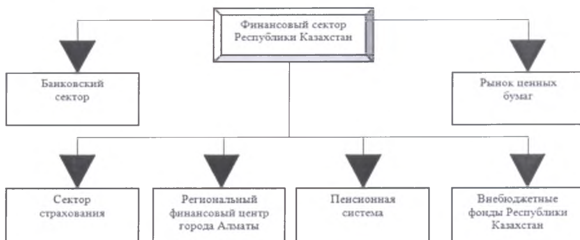
Рисунок 1 – Финансовый сектор РК

Стоит отметить, что финансовый сектор осуществляет свою деятельность также в качестве связующего звена между другими секторами экономики, так как в этой сфере реализуется сбор, накопление финансовых ресурсов, финансовых инструментов, услуг, доступ и управление над ними. Структура финансового сектора РК изображена в соответствии с рисунком 1 [2].