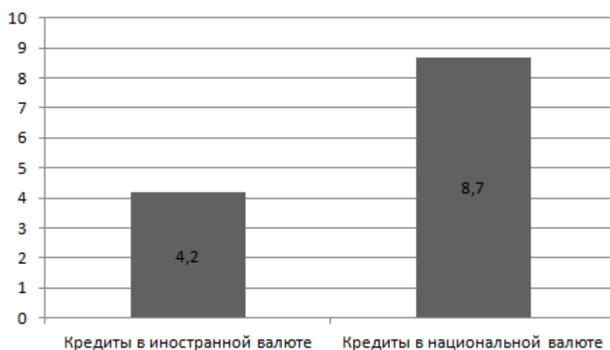
Рис. 1 – Кредиты, выданные в валюте на 2016 год, трлн. тенге

В 2016 году объем кредитования банками экономики увеличился на 1,5% (рост на 4,7% в 2015 году за счет валютной переоценки кредитов в иностранной валюте), составив 12,9 трлн.тенге. В числе основных факторов, препятствовавших росту кредитования, можно отметить изменение условий фондирования, ужесточение кредитных условий банков и снижение спроса со стороны кредитоспособных заемщиков. Кредиты в национальной валюте за 2016 год увеличились на 3,2% до 8,7 трлн. тенге, тогда как кредиты в иностранной валюте понизились на 1,9% до 4,2 трлн. тенге. В итоге удельный вес кредитов в тенге в общем объеме повысился с 66,3% до 67,4% (см. Рисунок 1).