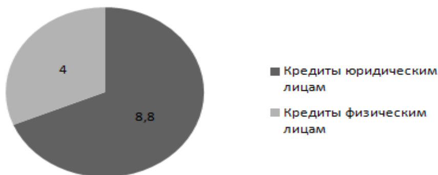
Рис. 2 – Соотношение кредитов, выданных юридическим и физическим лицам, трлн. тенге

конец 2016 года. При этом удельный вес кредитов, выданных физическим лицам снизился с 32,9% до 31,4%. В денежном эквиваленте кредиты юридическим лицам на конец 2016 года выросли на 3,6%, составив 8,8 трлн. тенге, кредиты физическим лицам снизились на 2,9% до 4,0 трлн. тенге (см. Рисунок 2) [7].