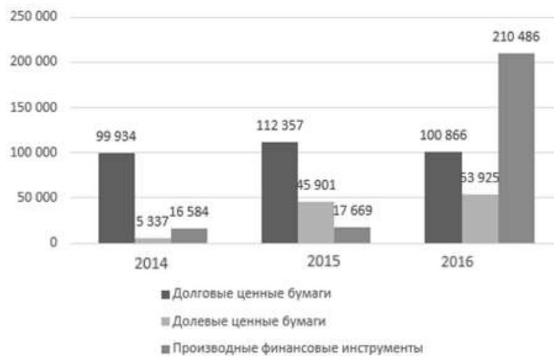
Figure 1. Transactions of JSC Kazkommertsbank in the security market, in mln tenges

Information about the largest active transactions of JSC Kazkommertsbank in the international financial markets and their share in general set of the performed transactions is provided in the figure 1.