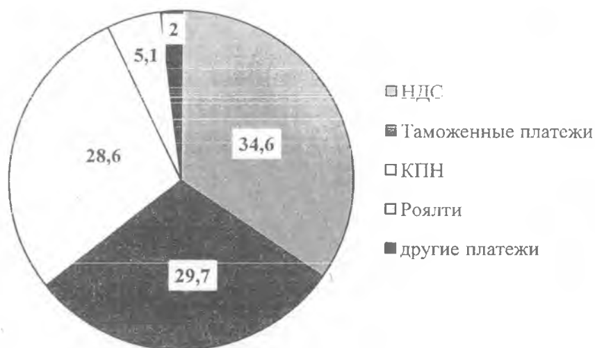
Рисунок 2. Структура доходов РБ на 2016г.

Как раз последнее показывает разницу в источниках пополнения доходов республиканского и местных бюджетов. В РБ поступают главные налоги, как по значимости, так и по размеру - КПН, НДС, налоги на международную торговлю и внешние операции - их совместная доля в бюджете составляет более 90% всех поступлений (рисунок 2) (данные Минфина РК) [4].