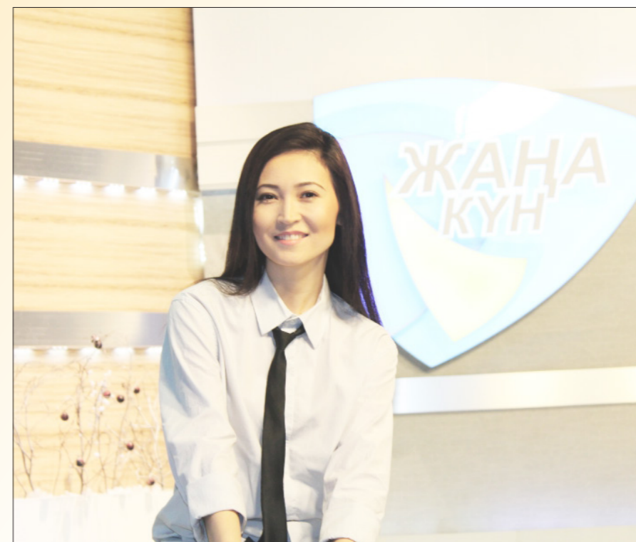
«Менің теледидардағы алғашқы жұмысым тікелей эфирден басталды»