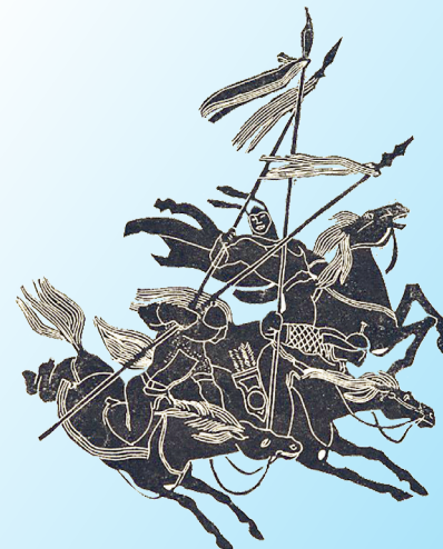
ДӘСТЕМНАМА (тарихи дастан) (үзінді)

тарихшылардың қасиетті борышы. Сондықтан да бабамыздың ұрпағына қалдырған құнды мұрасын оқырман қауымға қайта ұсынуды жөн санадық.